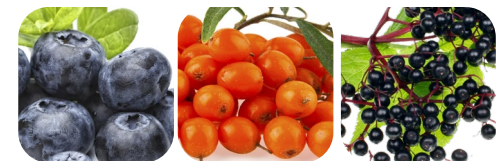
jagoda borówka rokitnik pospolity czarny bez