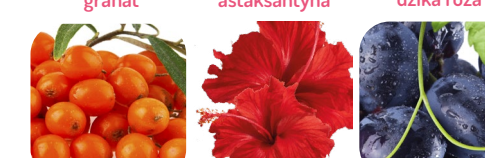
rokitnik hibiskus ciemne winogrono acerola