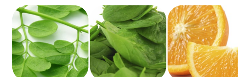
moringa oleifera szpinak pomarańcza alga spirulina