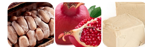
ziarno kakaowca owoc granatu beta glukan wiśnia cynamon żurawina dynia owoc dzikiej róży