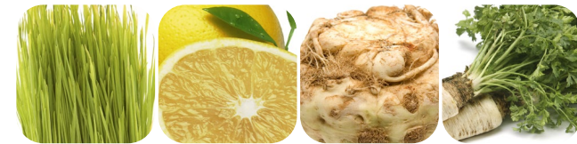
zielone pędy pszenicy grapefruit seler pietruszka