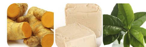
kurkuma beta-glukan zielona herbata karczoch moringa oleifera szpinak pomarańcza alga spirulina