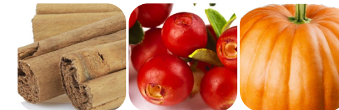
cynamon żurawina dynia owoc dzikiej róży