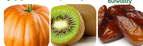
dynia kiwi daktyle owoc dzikiej róży