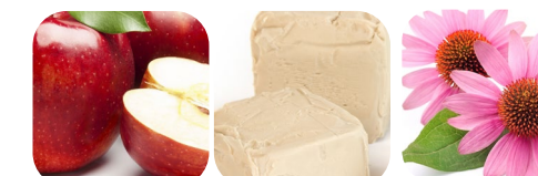
jabłko beta-glukan echinacea granat astaksantyna dzika róża aronia