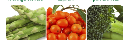
szparagi rokitnik pospolity brokuły marchew