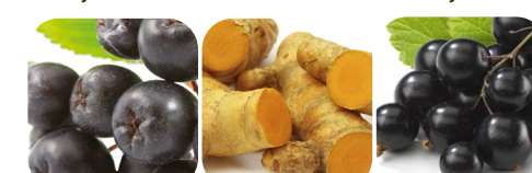
aronia kurkuma czarna porzeczka burak