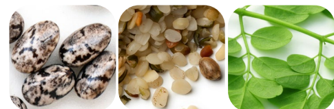
olej z ziarna chia olej konopny moringa oleifera grzyby shiitake pomidory słonecznik bulwiasty karczoch