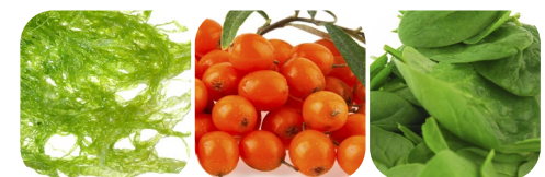
alga spirulina rokitnik pospolity szpinak