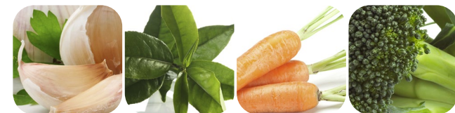
czosnek zielona herbata marchew brokuły