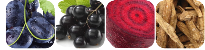
ciemne winogrono czarna porzeczka burak żeń-szeń