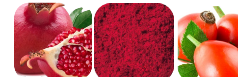
granat astaksantyna dzika róża aronia