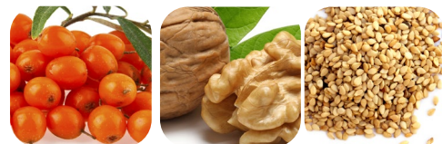
olej z miąższu rokitnika pospolitego olej z orzechów włoskich olej z ziarna sezamu owoc granatu aronia jabłko jagoda borówka