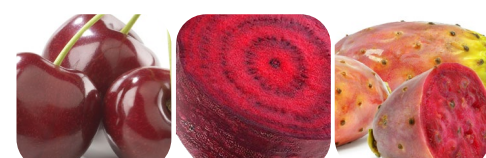
wiśnia burak opuncja beta-glukan