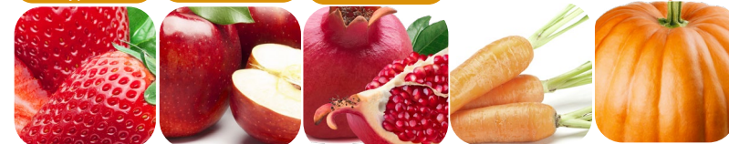
truskawki jabłka owoc granatu marchew dynia