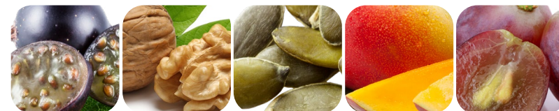
olej z pestek czarnej porzeczki olej z orzecha olej z pestek dyni mango wyciąg z pestek winogrona